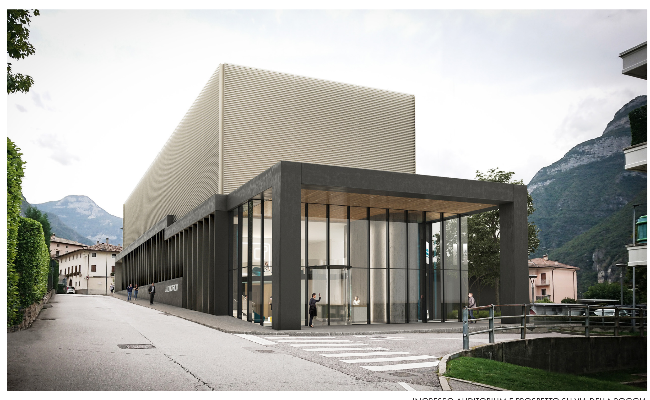
INGRESSO AUDITORIUM E PROSPETTO SU VIA DELLA ROGGIA