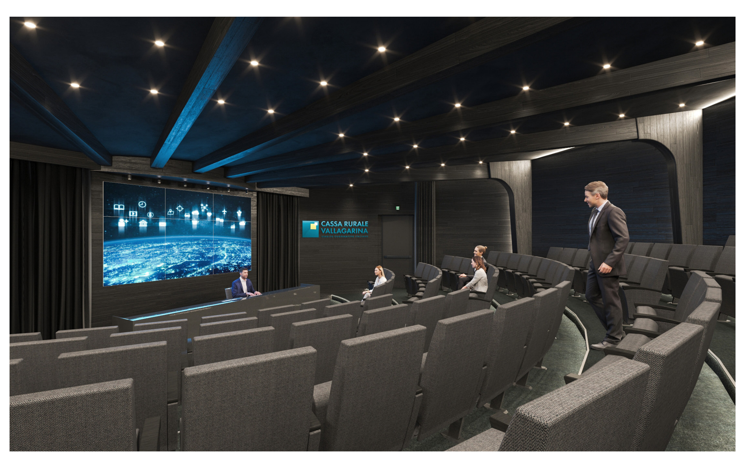
NUOVA CONFIGURAZIONE AUDITORIUM